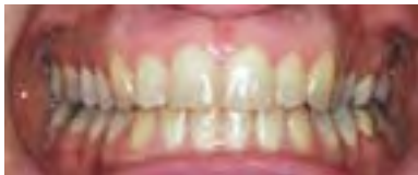
Gelbliche Zahnfarbe vor dem Bleichen