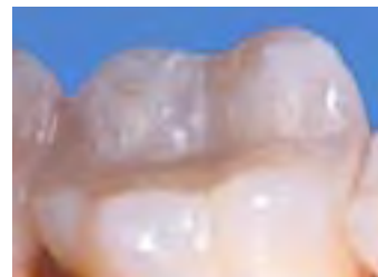
Keramik-Inlay eingesetzt- als Zahnersatz nicht erkennbar.