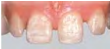
Zahnsituation vor einer Veneer Restauration