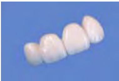
Frontzahnkrone und Seitenzahnkrone aus Keramik-dem natürlichen Zahn nachgebildet und metallfrei

Beschliffener Nachbarzahn als Brückenpfeiler