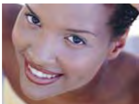
mit schönen weißen Zähnen...