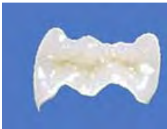
Präzises Keramik-Inlay im zahntechn. Labor hergestellt.