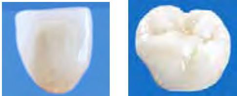
Frontzahnkrone und Seitenzahnkrone aus Keramik-dem natürlichen Zahn nachgebildet und metallfrei

Natürliche Ästhetik durch individuelle Zahnform- und Zahnfarbgestaltung. Optimale Körperverträglichkeit durch reine hochwertige Keramik - vollkommen metallfrei.