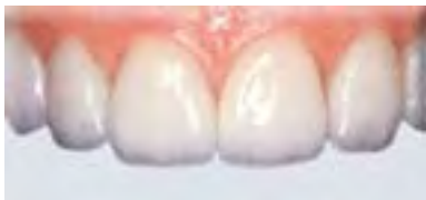
Eingegliederte Keramik Veneers.