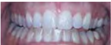
Ein deutlich sichtbarer Unterschied nach dem Bleichen