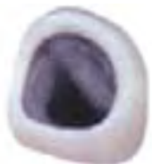
Krone mit keramischer Schulter