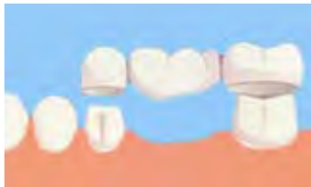
Brückenglied schließt die Lücke

Beschliffener Nachbarzahn als Brückenpfeiler