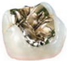
Präzises Gold-Inlay im zahntechnischen Labor hergestellt.