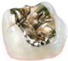
Präzises Gold-Inlay im zahntechnischen Labor hergestellt.